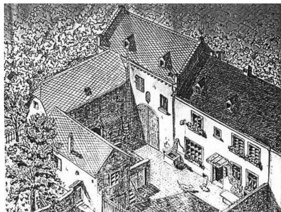
Der Rommersdorfer Hof in Moselweiß

Wein und Mittelalter waren untrennbar miteinander verbunden. Mit viel Einfallsreichtum wurde der Wein schmackhaft gemacht. In dieser Zeit lebte auch Hildegard von Bingen von der viele Rezepturen überliefert sind. Die unterschiedlichsten Kräuter verfeinerten den Wein. Auch bei manch Pein und Unwohlsein war ein Kräuterwein nicht zu verachten.